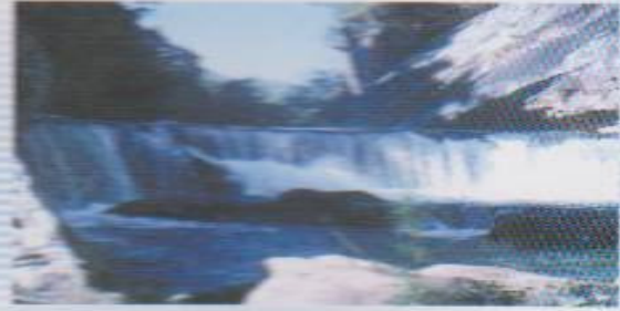
น้ำตกผาค้อ

น้ำตกผาค้อ อยู่ในลำน้ำเหือง ใช้ลำน้ำนี้เป็นเส้นแบ่งเขตแดนระหว่างไทย-ลาว พื้นที่รอบน้ำตกมีต้นไม้ขึ้นอยู่ทั่วไป อากาศร่มรื่นเย็นสบาย