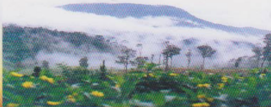
ภูดินสวนทราย

จุดชมวิว เนิน 1205 เป็นจุดชมวิวอีกที่หนึ่งที่สวยงามมาก อยู่ใกล้กับจุดชมวิว เนิน 1408 เหมาะสำหรับนักท่องเที่ยวที่ไม่ชอบเดินทางไกล จะมองเห็นวิวบ้านห้วยน้ำผักอยู่ด้านล่างและวิวภูสอยดาว ภูเวียงในประเทศลาว ส่วนวิวทางด้านเหนือจะเห็นภูเขาสลับซับซ้อนกันสุดสายตาที่จุดชมวิวมิลมพัดตลอดเย็นสบายมาก