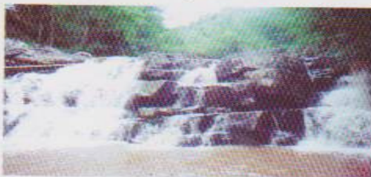
น้ำตกข้างตก

น้ำตกคิ่ง อยู่ในลำน้ำแพรมีลักษณะเป็นแก่งหิน ลดหลั่นกันลงมา 2-3 ชั้น อยู่ริมทางหลวง 1268 สายแสงภา เหล่ากอหก จุดนี้ทางราชการได้ก่อสร้างเรือนประทับถวาย สมเด็จพระเทพรัตนราชสุดาฯ สยามบรมราชกุมารี ซึ่งเสด็จ เมื่อวันที่ 12 กุมภาพันธ์ 2534