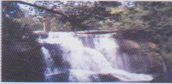
น้ำตกตาดเหือง