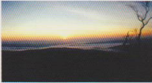
จุดชมวิว เนิน 1408

หินก่ายท้อ อยู่บนภูดินสวนทรายเป็นหินทรายรูปทรงคล้ายดอกเห็ดตูม โพล้ขึ้นมากลางป่าดงดิบความโตโดยรอบประมาณ 19 เมตร สูงประมาณ 4 เมตร รอบๆ หินมีร่องรอยเหมือนมีคนมาซุดเป็นร่องน้ำไว้ แต่โดยความเป็นจริงเป็นร่องที่เกิดธรรมชาติเป็นผู้สร้างขึ้นมาเอง