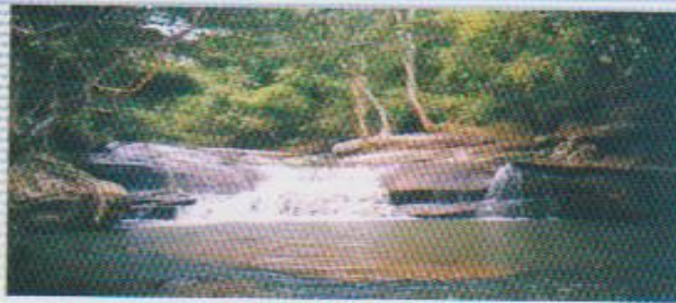
น้ำตกคิ่ง

มีลักษณะป่าประกอบไปด้วยป่าดงดิบ ป่าดิบแล้ง ป่าดิบเขา ป่าเบญจพรรณ และป่าเต็งรัง ซึ่งจะมีพรรณไม้ ซึ่งได้แก่ ตะแบก เก็ด ประดู่ ไม้เจ้า กระบก มะขามป้อม และกระทือ ฯลฯ