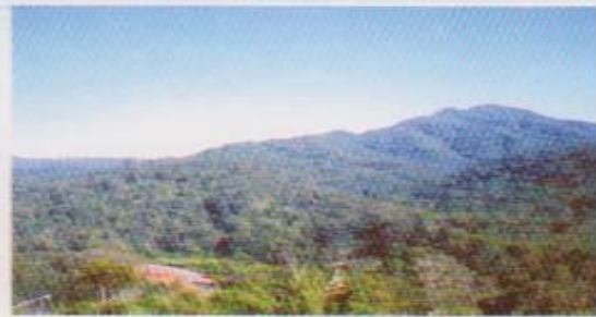
จุดชมวิว เนิน 1205

จุดชมวิว เนิน 1408 เมื่อมองลงไปทางทิศตะวันออกเฉียงใต้จะเห็นบ้านบ่อเหมืองน้อย ทิวทัศน์ของป่าเต็งรังบ้านแสงภา อำเภอนาแห้ว จุดนี้หากขึ้นไปรอดูพระอาทิตย์ขึ้นยามเช้าจะสวยงามมาก บริเวณนี้เป็นที่ราบสันเขายาว เหมาะที่จะเดินพักผ่อนยิ่งนัก นับว่าเป็นใจกลางของอุทยานนาแห้วอย่างแท้จริง