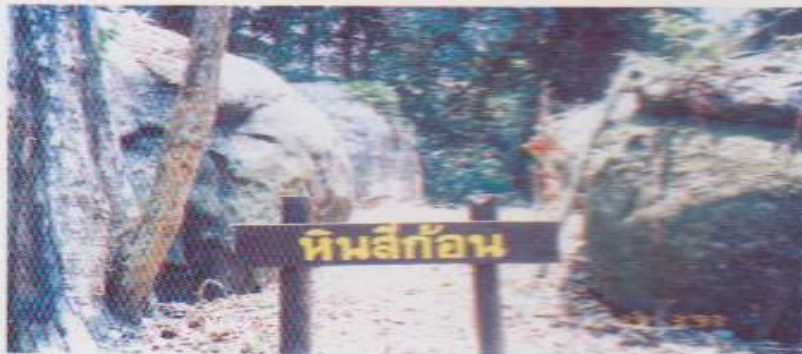
หินสี่ก้อน

น้ำตกตาดผา เป็นน้ำตกสูงประมาณ 60 เมตร ลดหลั่นกันเป็นชั้นๆ มีหน้าผาสูงชัน มีโขดหินเรียงกันเป็นชั้นอย่างสวยงาม น้ำตกอยู่ในเขตป่าลึก สภาพป่าและน้ำตกมีความเป็นธรรมชาติมาก เหมาะกับนักท่องเที่ยวที่ชอบธรรมชาติอย่างแท้จริง น้ำตกอยู่บริเวณบ้านแสงภา ห่างจากที่ทำการอุทยานแห่งชาติ ประมาณ 16 กม.