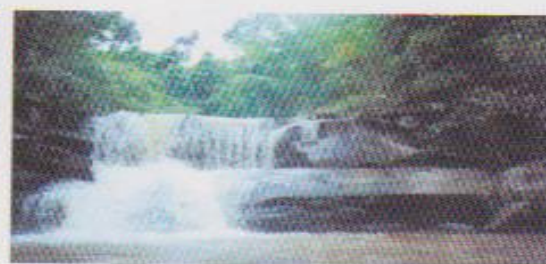
น้ำตกวังตาด

น้ำตกข้างตก อยู่เหนือน้ำตกคิ่งขึ้นไปประมาณ 500 เมตร อยู่ในลำน้ำแพรมเช่นกัน แต่มีความลาดชันมากกว่า